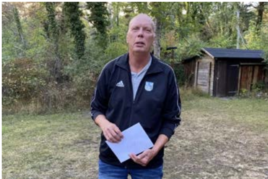
Wisby Bollklubb firade 142 år.

Vissa trycksaker kommer givetvis att skickas ut i pappersform ändå som verksamhetsberättelse och andra viktiga papper.