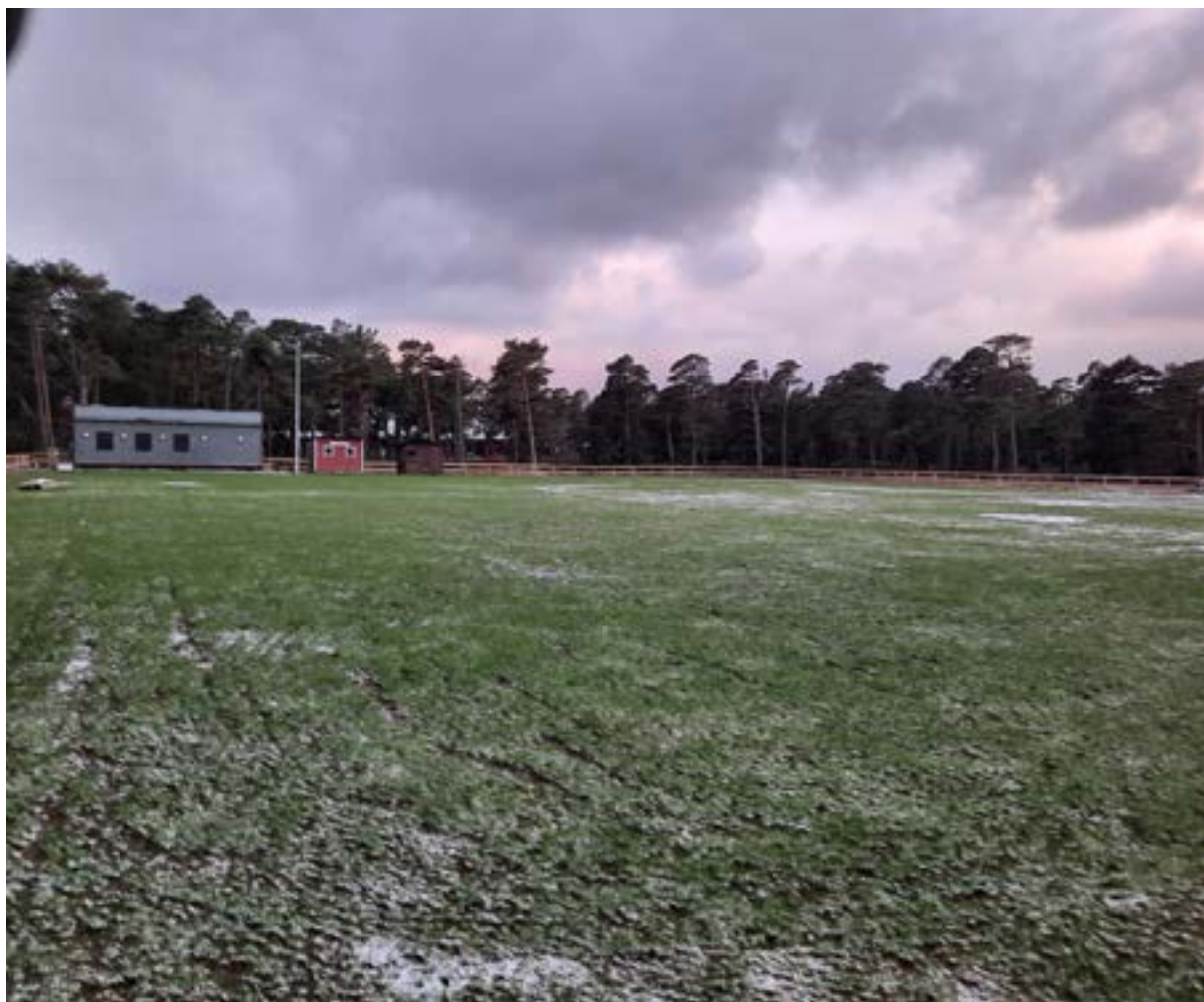
Mulde VK Varpaplan och hundrastgård.