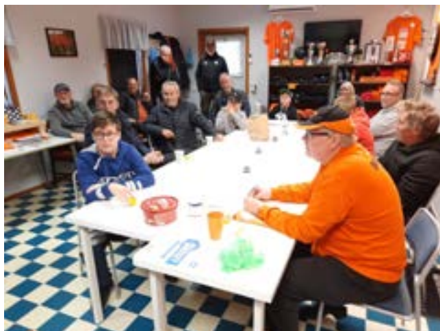
En uppskattad fikapaus.