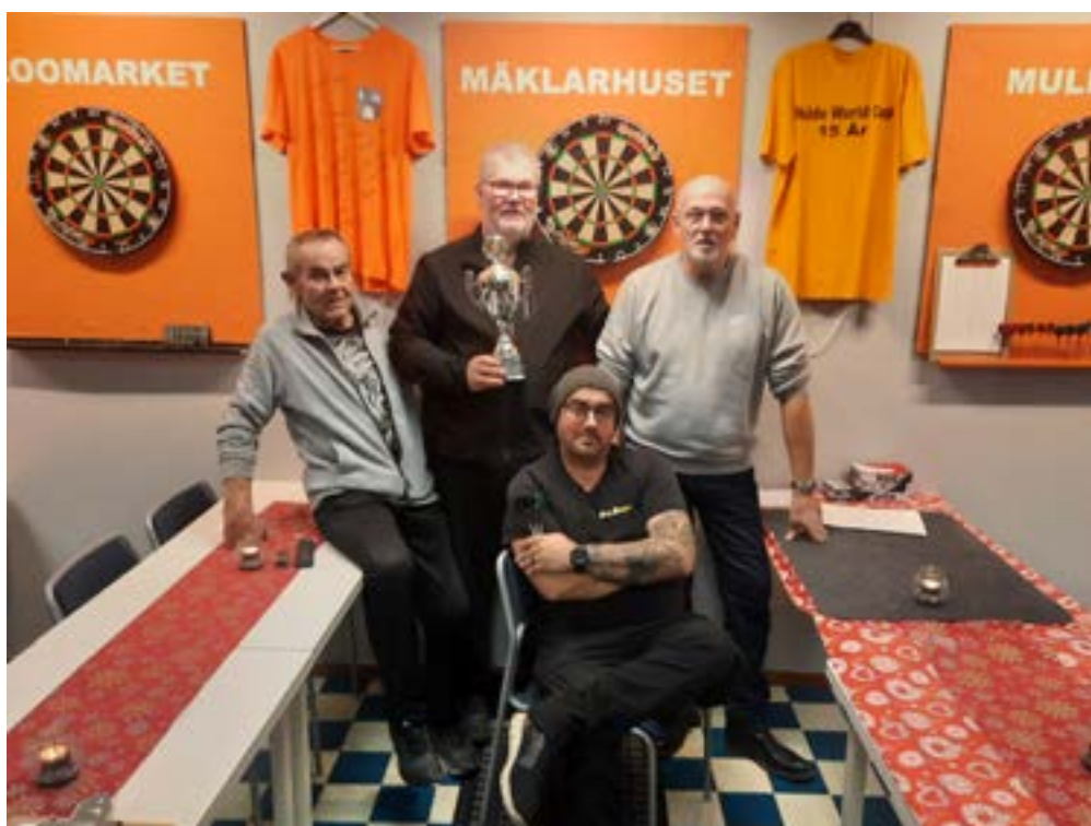
Dartvinnarna på bild.