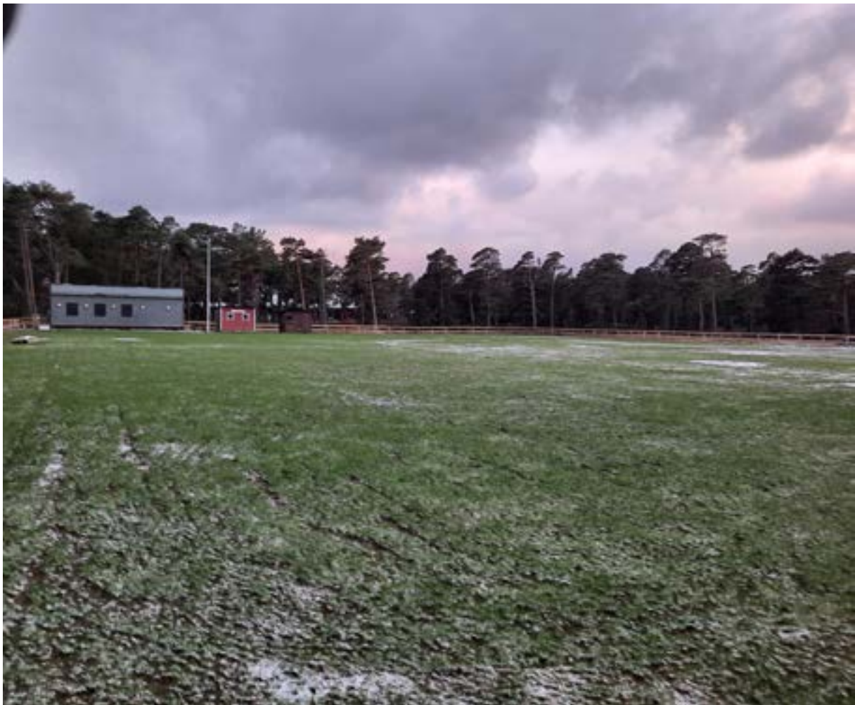
Mulde VK idrottsplats