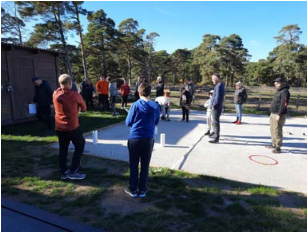
Jubileumsdag, Mulde VK