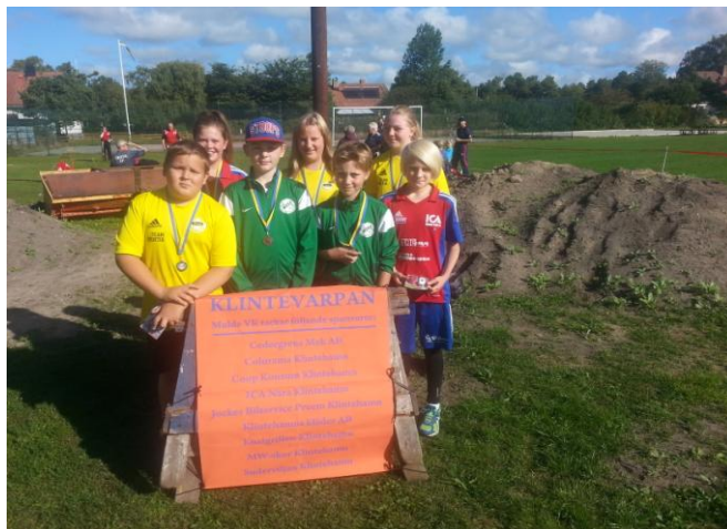
DM Ind ungdomar. Klintevallen