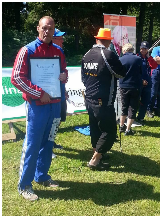
Berne Appelqvist Hablingbo IK